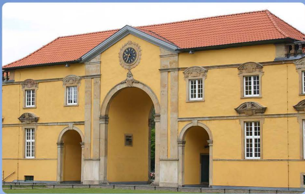
Osnabrücker Schloss Neuer Graben / Schloss 49074 Osnabrück